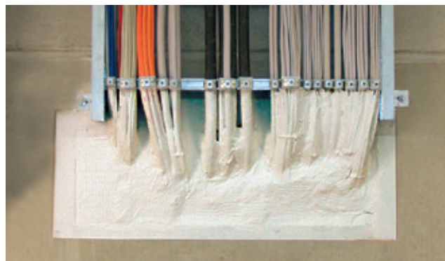
Przykład wbudowania: ISO-FLAME PLATTE S90