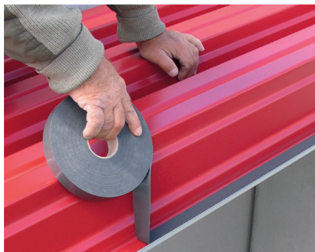
Einbaubeispiel: ISO-ZELL FIXBAND