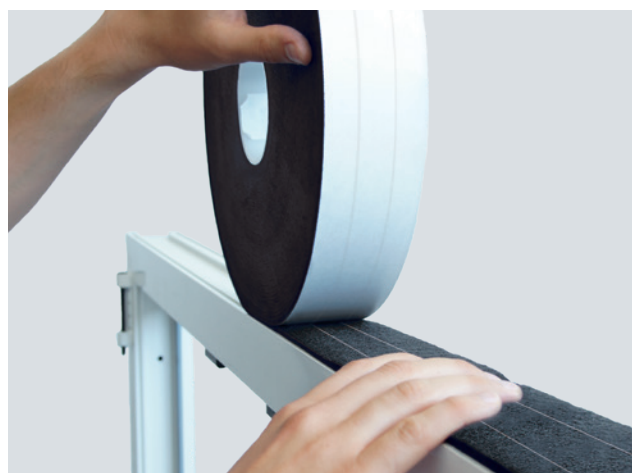
Ejemplo de instalación: ISO-BLOCO HYBRATEC

* El movimiento de elementos estructurales y los cambios de longitud temporales de las juntas deben tenerse en cuenta para dimensionar correctamente la cinta.