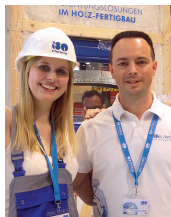
Unser bekanntes Handwerkergirl war auch wieder live dabei.

Herzlichen Dank an alle, die sich auf der Welitleitmesse für Architektur, Materialien, Systeme über die Produktwelt unserer „Blauen Abdichtungstechnologie“ informiert haben.